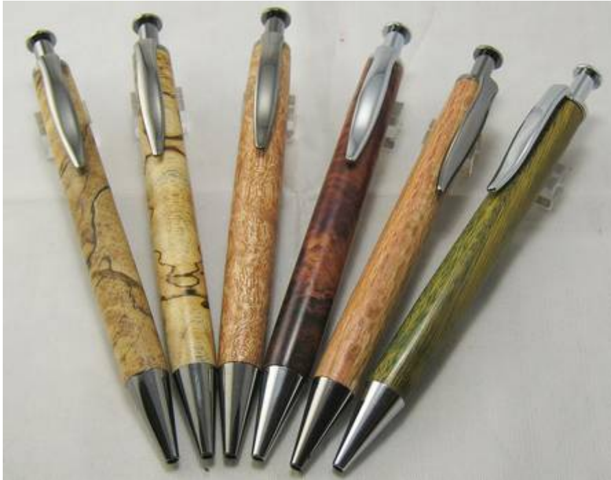
Bausatz/Holzart von links: Black Titanium/ 2 x White Stinkwod Crosscut, Bubinga Splint, Chrom / Madagaskar Palisander, Black Titanium / Silky Oak, Chrom / Pockholz