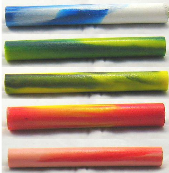
R 01 blau/weiß