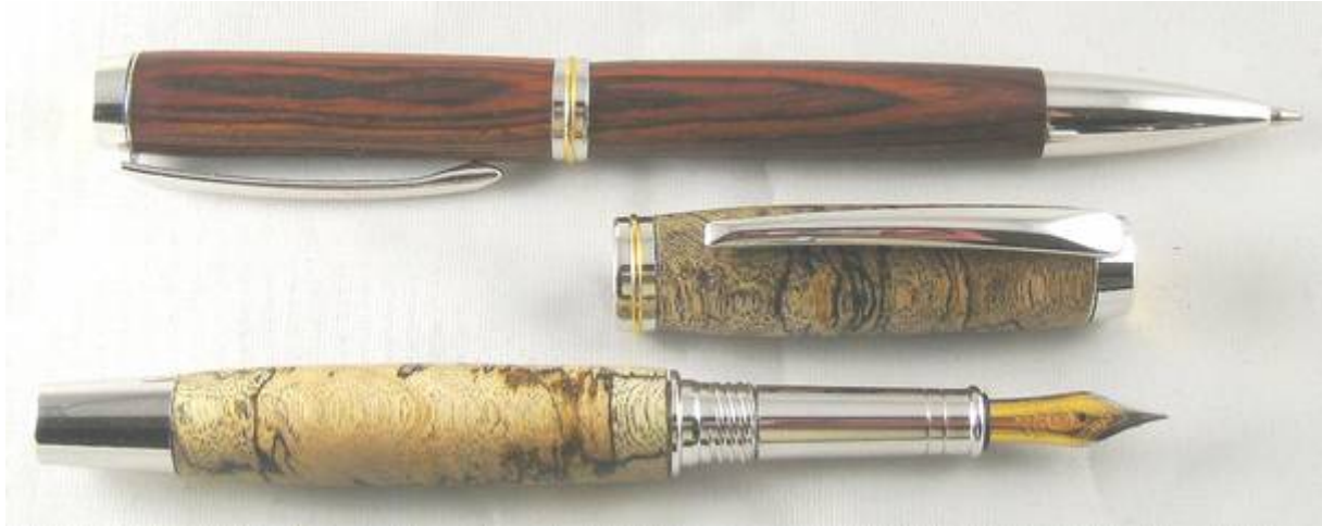
Oben Drehkugelschreiber jun. Gentlemen´s Holz Cocobolo Unten Füller jun. Gentlemen´s Holz White Stinkwood Crosscut