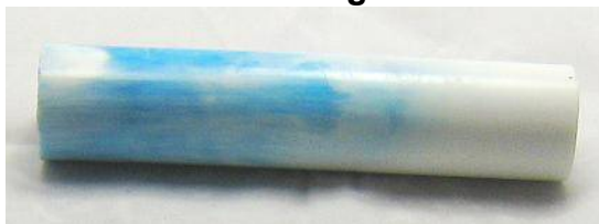
R 31 Himmellblau